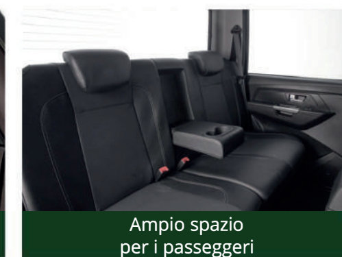
Ampio spazio per i passeggeri