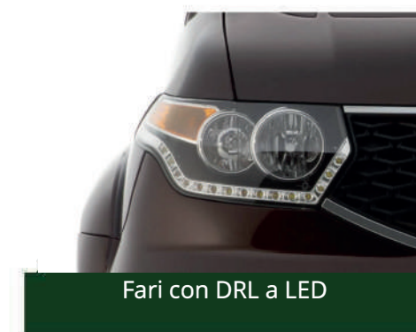
Fari con DRL a LED