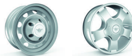
Cerchi da 16", per maggior comfort di guida, anche in off-road