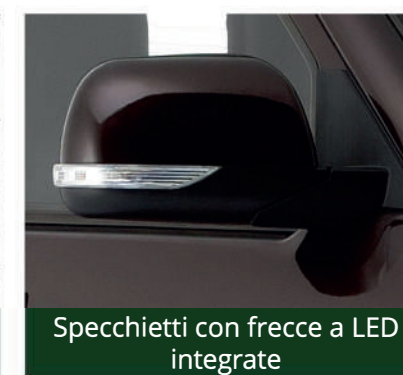
Specchietti con frecce a LED integrate