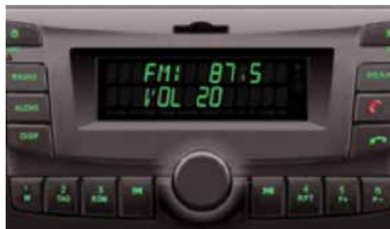
Impianto audio FM/MP3/USB