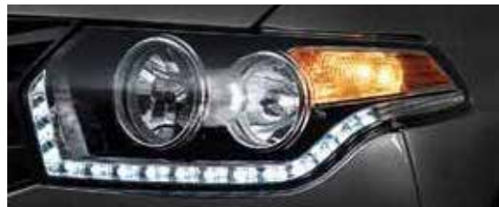
Fari con DRL a LED